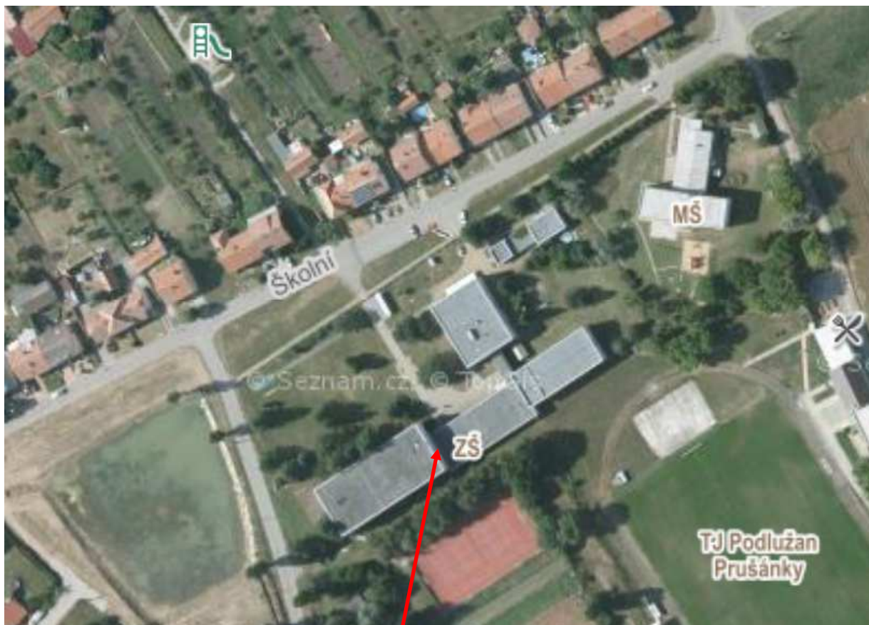
Základní škola (sever nahoře, západ vlevo).